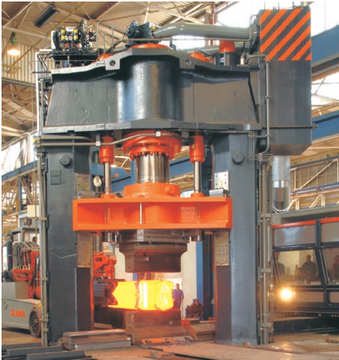
1: Beispiel einer Schmiedepresse